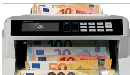
Verifica le banconote con 7 caratteristiche di sicurezza