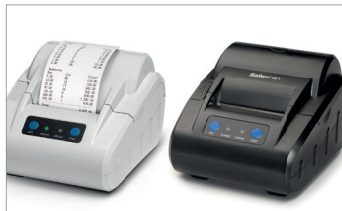
Safescan TP-230 Stampante Art. no: 134-0475 grigio Art. no: 134-0535 nero