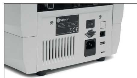
Porte di aggiornamento delle valute, collegamento alla stampante di ricevute