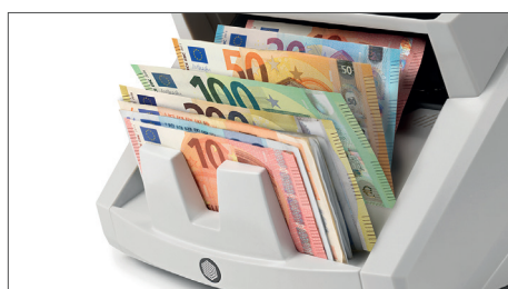
Conteggio del valore per banconote miste