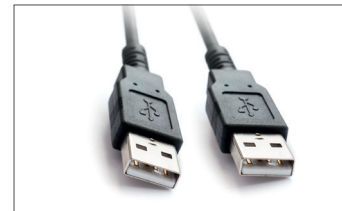
Safescan USB Cable Art. no: 124-0458