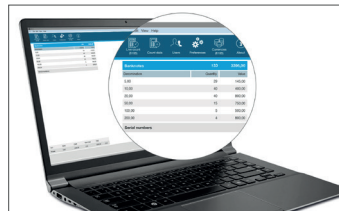
Safescan MCS Software Art. no: 131-0500