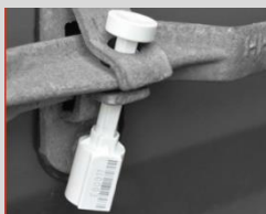
Sigillo a proiettile in plastica e metallo