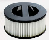
Filtro HEPA di ricambio Replacement Hepa filter Codice|Code 119991000