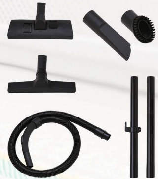
Accessori inclusi Accessories included