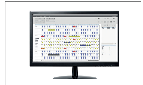
TimeMoto PC Software Plus N. art.: 139-0602