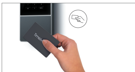
Timbratura con scheda di prossimità RFID o codice PIN