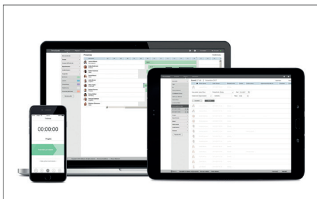
TimeMoto Cloud / TimeMoto Cloud Plus N. art.: 139-0612 / 139-0613