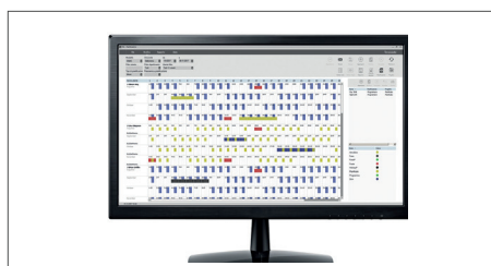
Software TimeMoto per desktop per un solo PC incluso