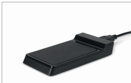
Lettore RFID TimeMoto RF-150 USB N. art.: 125-0605