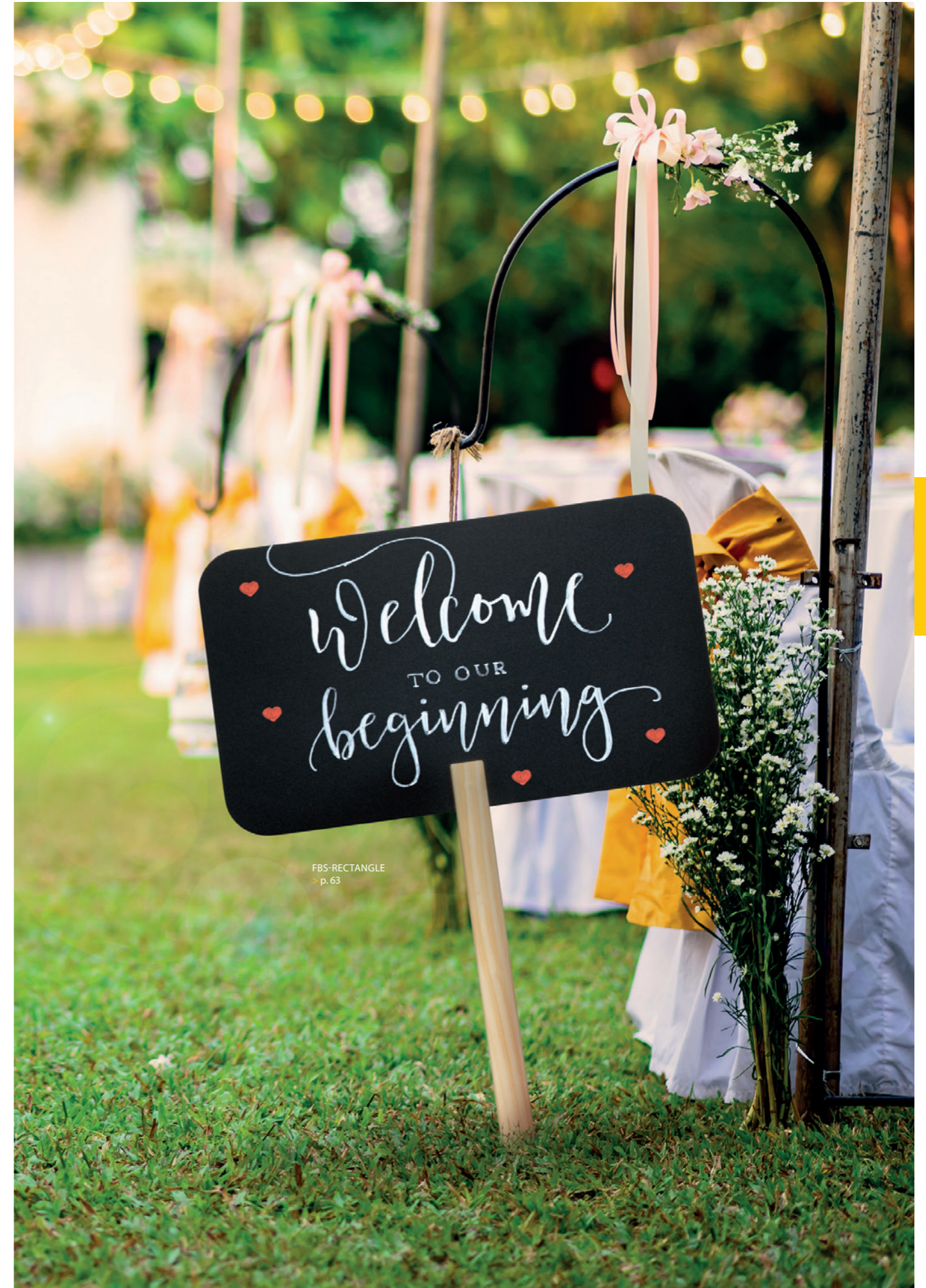
FBS-RECTANGLE p. 63