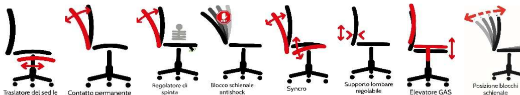
le immagini sono rappresentative dei movimenti delle sedute

Elevazione a gas; - supporto lombare regolabile ; - Meccanismo synchro tra sedile e schienale, a contatto permanente schienale con ritorno controllato da con 4 blocchi antishock; - Sedile dotato di traslatore (avanti e indietro)