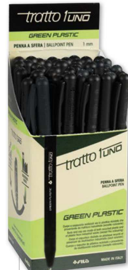
Cod. F838303 In astuccio 50 pz monocolore NERO