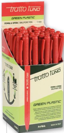
Cod. F838302 In astuccio 50 pz monocolore ROSSO