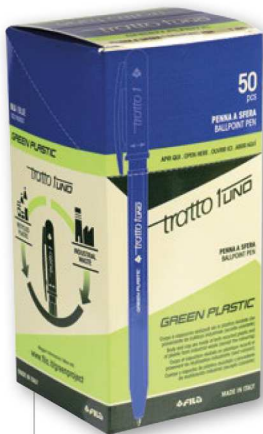
Cod. F838301 In astuccio 50 pz monocolore BLU