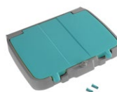
Coperchio doppio fondo per portasacco 120 L