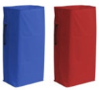
Sacco plastificato 120 L