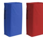
Sacco plastificato 120 L con cerniera