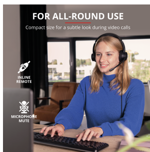
PRODUCT PICTORIAL 1