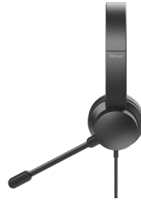
PRODUCT SIDE 2