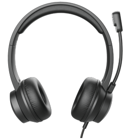
PRODUCT FRONT 1