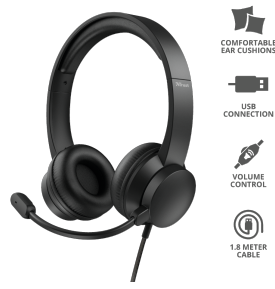
PRODUCT ESHOT 1