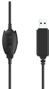
PRODUCT EXTRA 1