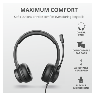
PRODUCT PICTORIAL 2