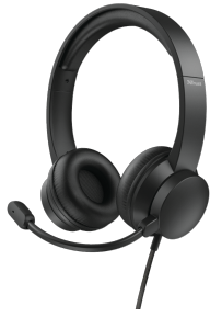
PRODUCT VISUAL 1