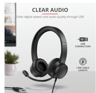
PRODUCT PICTORIAL 3