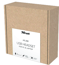
PACKAGE VISUAL 1