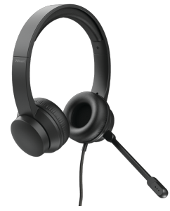
PRODUCT VISUAL 2