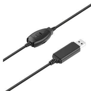
PRODUCT EXTRA 2