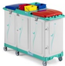
Magic Line 390E