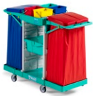
Magic Line 230B