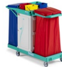
Magic Line 390S