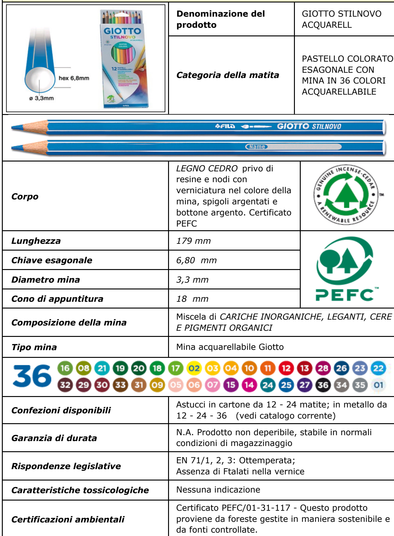
TABELLA CARATTERISTICHE DEI PASTELLI GIOTTO STILNOVO ACQUARELL